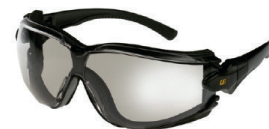
categoría de filtro: 2C-1.2