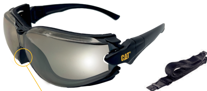
Espuma suave interna